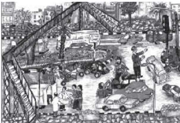
エジプトの交通安全児童絵画コンペ

小中学生や若者を対象としたポスターや随筆などの競技会を組織することができる。題材を選ぶ必要があり、参加する可能性のある人が要項を見られるようにする。随筆の選考基準を練って適用する。作品の評価がすべての参加者に伝わるようにする。ポスターや随筆に対して賞を授与しても良い。それらの作品をこの犠牲者の日のセミナーや宗教的儀式の際に展示したり、朗読してもよい。これらを組織する者にとって難しいのは、競争心が決してパートナーシップや共同の邪魔にならないように留意することである。