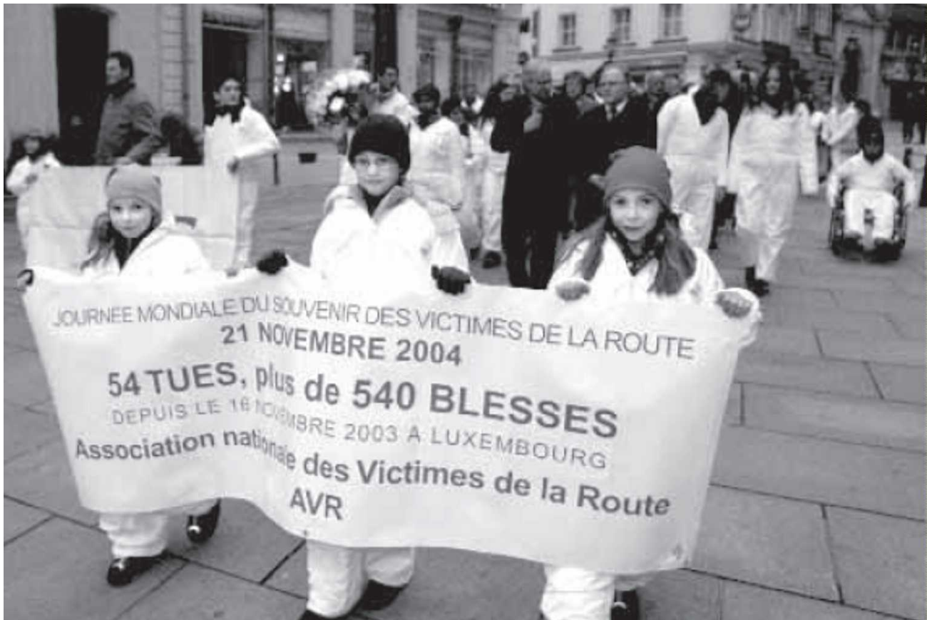
2004年、ルクセンブルグにて、白装束をまとった54人が街を行進した。この小さな国で1年間に交通事故で死亡した54人を象徴して。