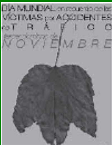
交通事故犠牲者の日を宣伝する スペインのポスター

毎年、世界中では 120 万人の人々が交通事故で命を落とし、その背後に破壊された家族と地域社会を残している。死亡例のほとんどは若年者であり、彼らの人生の最も花である時期であり、家族や地域社会にとっては彼らの貢献と存在そのものが非常に大切なものなのである。このような痛ましい出来事の影響は、苦悩がさらに蓄積されてゆくことでより重大なものとなっている。すでに何百万人も苦しんでいる人々の上に、さらに毎年何百万人も犠牲者が加算され、喪失した者に対する他者の不適切な反応によってさらに苦悩が増強されるという、まさに想像を絶するものとなっている 1, 2, 3, 4 )。持続する情緒的・精神的な苦しみはもちろん、家族の一員を失ったことで家族に相当な経済的負担がのしかかる。多くの国で、長引く医療費、一家の大黒柱を失ったこと、障害者をケアするための資金などで、しばしば家族は貧困へと転落させられる 1, 2, 3, 5, 6 )。問題の大きさにもかかわらず、交通事故による死亡、受傷、犠牲者の苦悩などの問題は今までほとんど無視され続けてきた 1, 2, 3, 5, 7, 8, 9 )。仲間である犠牲者に支援を行ってきたのは主に非政府組織の犠牲者組織だけだったし、交通事故によって引き起こされる極限の肉体的苦悩と社会の無関心に焦点を当てて人々の態度を変えようと努力してきたのもこれらの組織であった。年に一度、交通事故犠牲者を思い出す日を設定してこれらの犠牲者組織が記念する運動は 1993 年にイギリスで始まった。交通事故による死亡や負傷で壊滅的影響を受けること、支援が欠如していることを、より広く訴えるためである。この記念日は、今日では世界中に広がってきている。