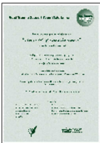
メルボルンでのセレモニーへの招待状（2005年）