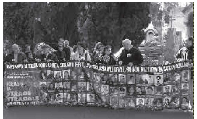
イタリアでの犠牲者の日の式典 2005年